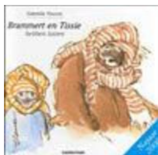
Brammert en Tissie hebben luizen ISBN 9789030395225, prijs: 9,95 euro

Voor wie: kinderen 1ste leerjaar, 2de leerjaar